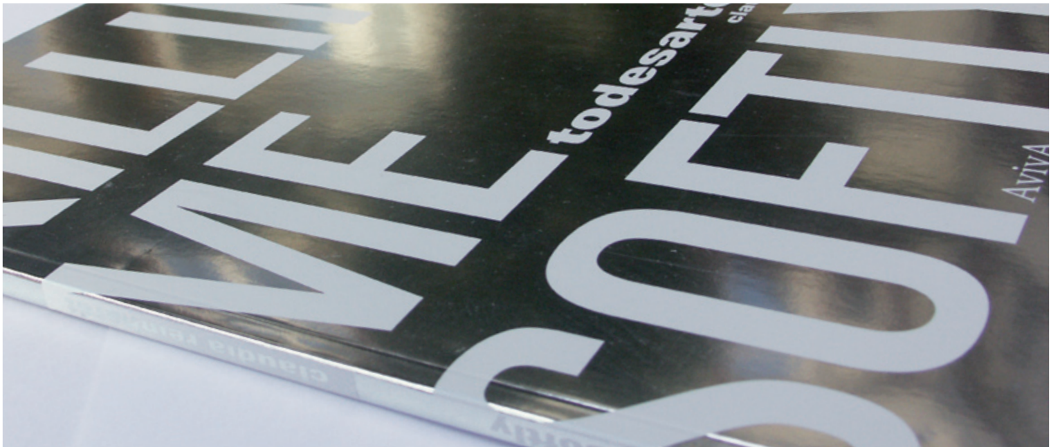
Publikation Killing me Softly Claudia Reinhardt, 2004