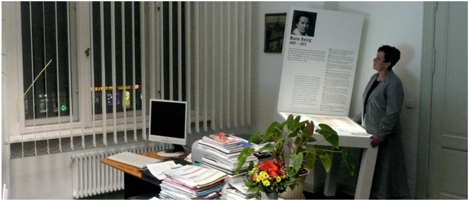
Ausstellung Vor die Tür gesetzt im Rathaus Lichtenberg Aktives Museum Faschismus und Widerstand in Berlin e.V., 2010